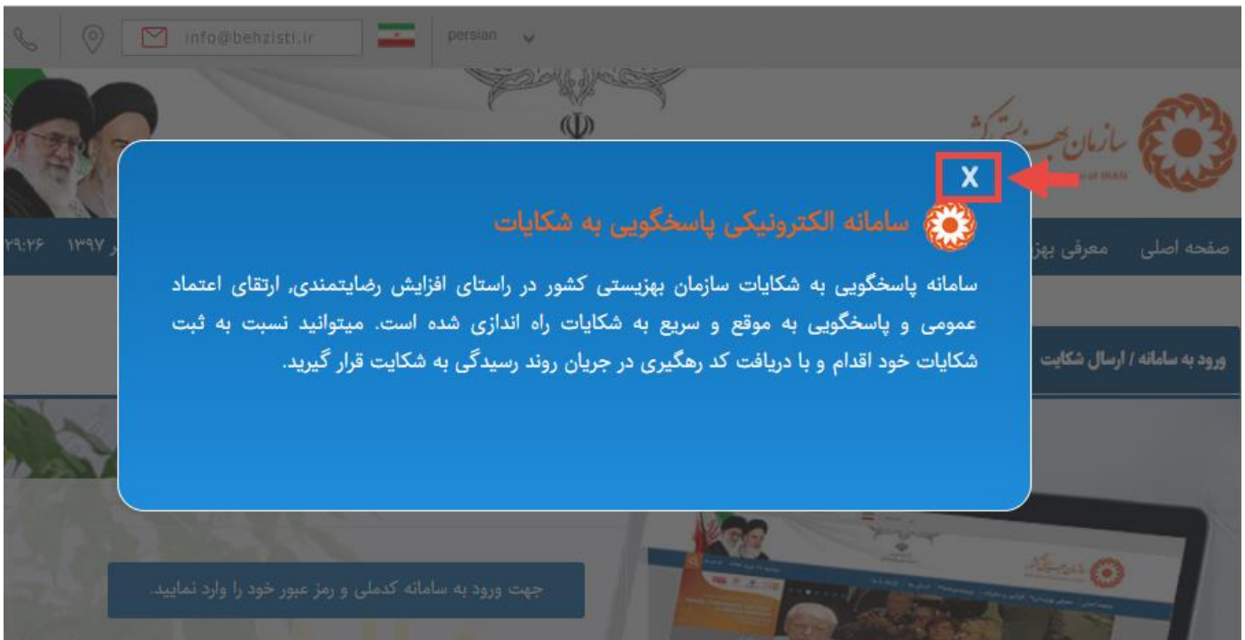
شکل ۱-۱ ، مطالعه هدف از پیاده سازی سیستم شکایات