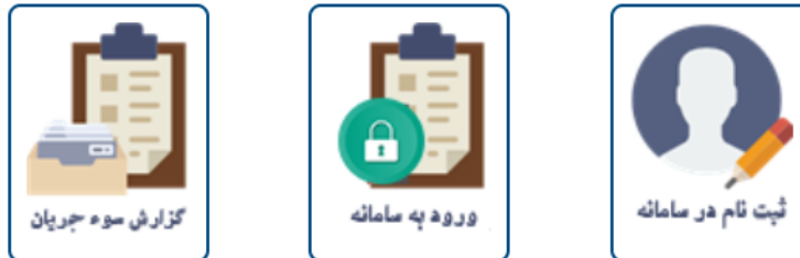
شکل 2 ثبت نام در سامانه سپس ورود به سامانه جهت ثبت ارسال شکایت

به گزارش روابط عمومی سازمان بهزیستی، در راستای پیشبرد نظارت و ارزیابی هوشمند، سیستم بر خط (آنلاین) ثبت و پاسخگویی به شکایات در سامانه شکایات با هدف تکریم مددجویان، تسهیل در ثبت درخواست و شکایات، چاپک سازی و تسریع در فرآیند بررسی و پاسخگویی با رعایت محرمانگی، طراحی و راه اندازی شده است. این سیستم در حال حاضر جهت شکایات مددجویان طراحی گردیده است. مددجویان می توانند از طریق ورود به سامانه نسبت به ثبت شکایات اقدام و با دریافت آنلاین کد رهگیری در جریان روند رسیدگی به شکایت خود قرار گیرند.