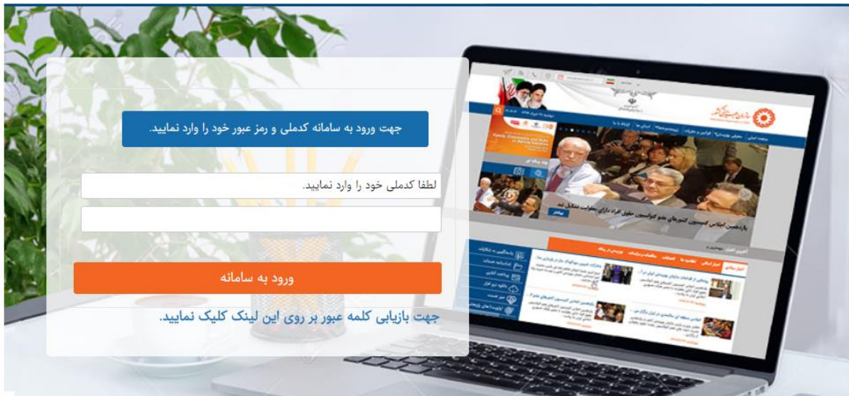
شکل ۵ - ورود کد ملی و رمز عبور جهت ورود به سامانه برای ثبت شکایت و پیگیری شکایت

جهت ثبت شکایت در سامانه و پیگیری شکایت های ثبت شده باید پس از ثبت مشخصات فردی و با در دست داشتن کد ملی و رمز عبور با استفاده از تب " ورود به سامانه / ارسال شکایت " در سامانه وارد شده.