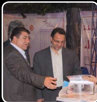
بازدید معاون پشتیبانی بهزیستی کشور