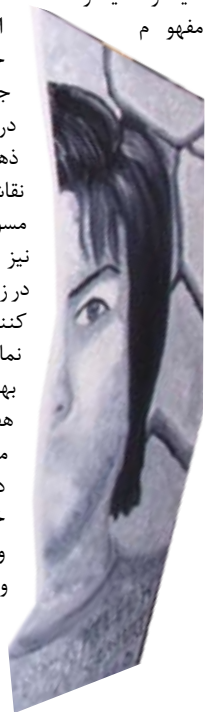
کسانی آمده بودند

در غرفه های متعلق به افراد تحت پوشش سازمان بهزیستی، مددجویان توانسته بودند با استفاده از امکانات سازمان بهزیستی، در شغل و کاری مناسب مشغول به کار شده و در این راه به نتایج خوبی برسند. غرفه هایی همچون جواهر سازی، نقاشی سیاه قلم و تابلوهای زیبا، قطعات اتومبیل، نرم افزار و سخت افزار رایانه، ساخت دکوراسیون با استفاده از فلزات زائد و دور ریختنی و... به چشم می خورد. زنان سرپرست خانوار با گلدوزیهای زیبایی که بر روی پارچه ها انجام داده بودند و ترمه های زیبایی که انسان را ناخودآگاه به تحسین وامی داشت.