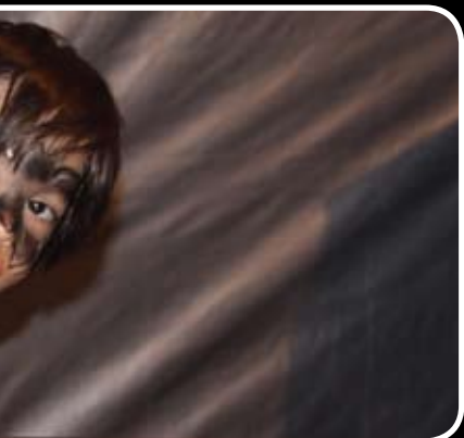
چشمهای کوچک، پر