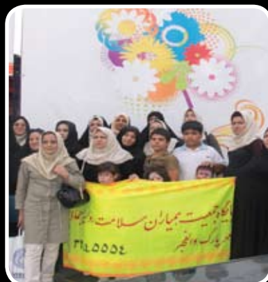
حضور همیاران سلامت در نمایشگاه