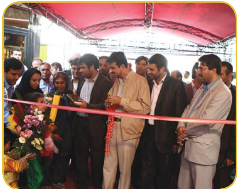
آیین افتتاح نمایشگاه