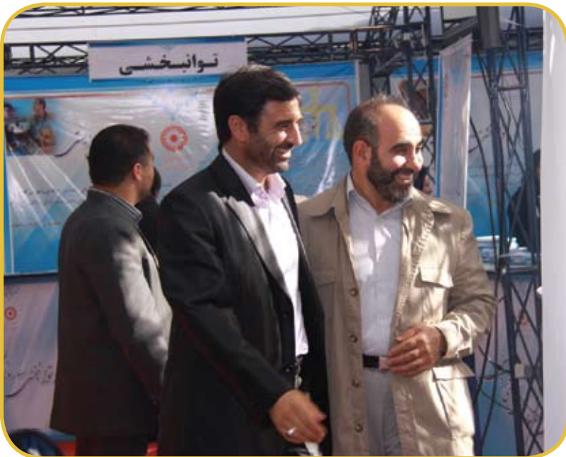
بازدید براتلو معاون سیاسی امنیتی استانداری تهران