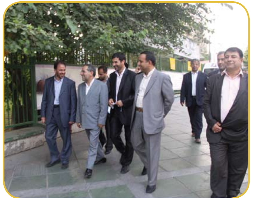
استاندار هم آمد