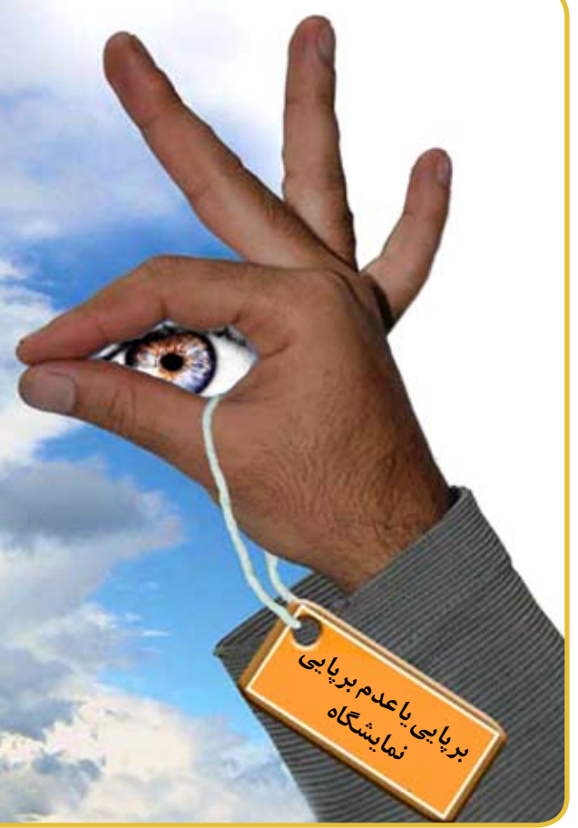
نمایشگاه بهزیستی ۸۸

قرار گرفتن این مرکز در خیابان ولیعصر و نزدیکی آن به یکی از میدانی اصلی شهر، (میدان ونک) به برپایی نمایشگاه کمک قابل توجهی می‌کرد، زیرا در اطلاع‌رسانی‌ها، دادن نشانی شیر خوار گاه آمنه، کار را آسان می‌کرد. فاکتور مهم‌تر، دیواره طولانی این مرکز در خیابان ولیعصر بود که با طولی برابر ۸۰ متر، فضای مناسبی برای نصب بنرهای اطلاع‌رسانی یا هر نوع استفاده نمایشگاهی، فراهم می‌کرد. اما یک مشکل هم وجود داشت. فضای محدود حیاط این مرکز، با مساحتی به میزان ۴۴۰ متر مربع، ایجاد غرفه‌های متعدد و مانور برای میلمان نمایشگاهی را محدود می‌کرد.