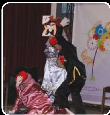
اجرای تئاتر در شیر خوار گاه