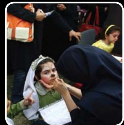
غرفه کودکان و دنیای رنگها