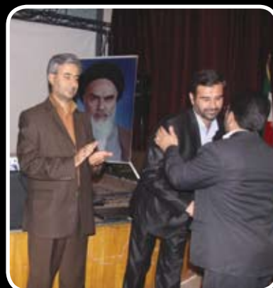
تقدیر از دبیرخانه شورای فرهنگی