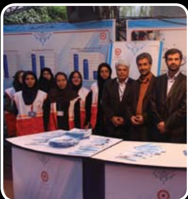
مدیر کل با کارکنان حوزه توانبخشی