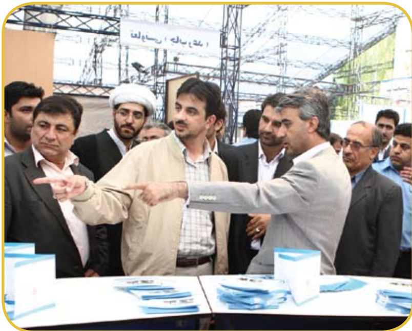
بازدید رییس سازمان از غرفه توانبخشی