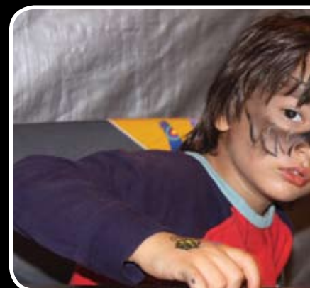
رسمش های بزرگ