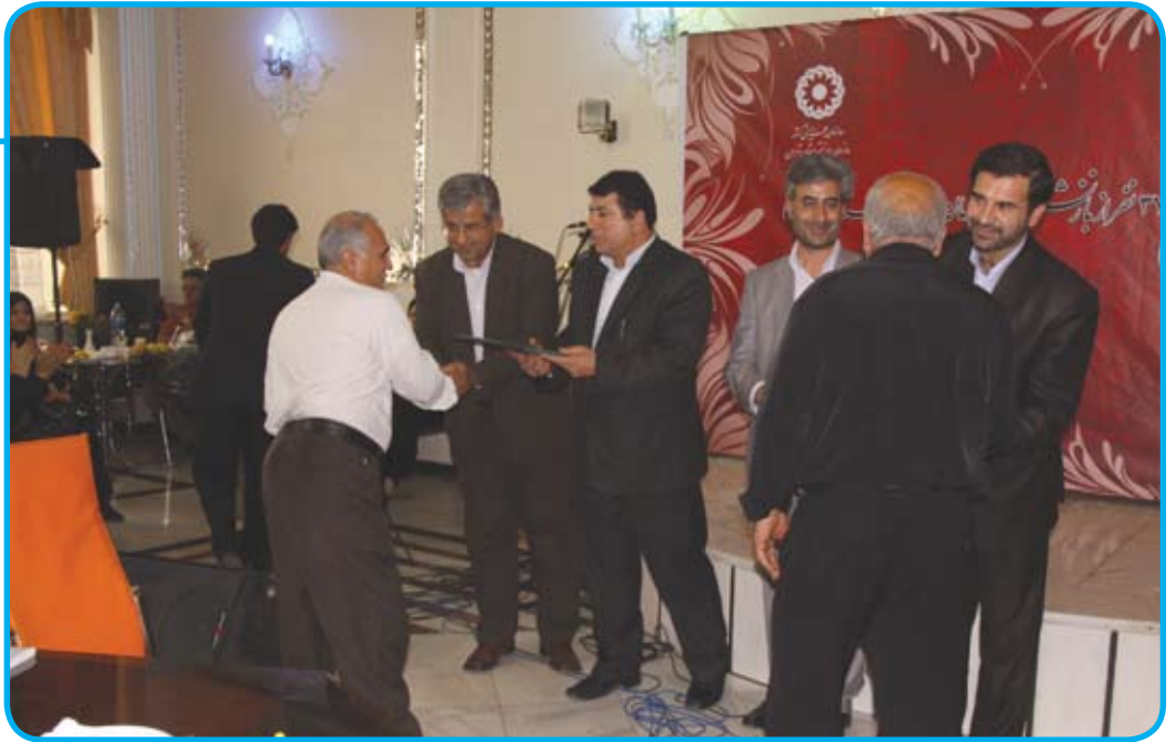
مدیر کل بهزیستی استان تهران: