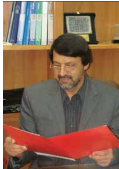
■ آقای مهندس اگر امکان دارد تاریخچه مختصری از ورود شهرداری به بحث مناسب سازی را بیان کنید.

شهرداری در هر حال مکانیسم هایی دارد که سایر سازمان ها ندارند، شهرداری است که وظیفه صدور پایان کار و پروانه ساختمانی را بر عهده دارد، لذا یکی از دلایل موفقیت فعالیت های شهرداری در زمینه مناسب سازی این بوده است که ما به تمامی مناطق اطلاع کرده ایم که اگر در طراحی ساختمانی موضوع مناسب سازی رعایت نشده باشد، پروانه صادر نشود. همچنین به شهرداری ها اعلام شده، اگر مناسب سازی در ساختمانی اجرا نشده باشد، نیز پایان کار داده نشود. حتی ساختمان های قدیمی را مجبور به مناسب سازی کرده ایم، این رمز موفقیت شهرداری است که باید در اجرای مناسب سازی دخالت کند و سازمان های دیگر هم می توانند با توجه به امکانات خود کارهایی را انجام دهند. کمیسیون ماده ۱۰۰ شهرداری نیز قوانینی دارد که مالک ساختمان را ملزم به