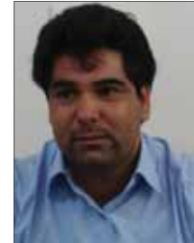
بازدید از مرکزی که آماده واگذاری است